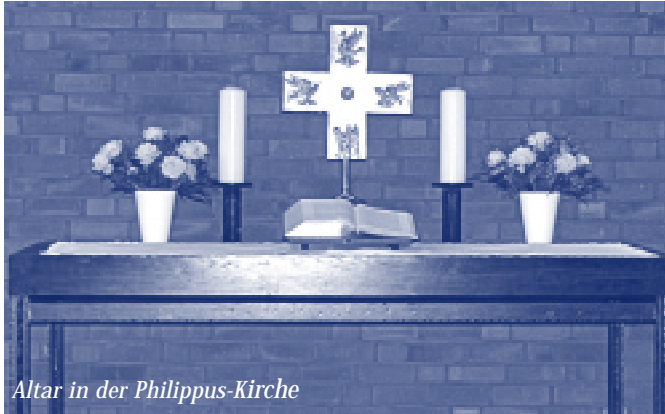
Altar in der Philippus-Kirche

Dieses Jahr feiern wir zwischen Aschermittwoch und Karfreitag sechs ökumenische Passionsandachten. Wir bedenken dabei neu das Leiden und Kreuz Jesu, das am Karfreitag seinen Tiefpunkt findet. In der Zeit machen wir uns bewusst, dass wir einen Gott an unserer Seite haben, der nicht hoch erhaben über uns schwebt, sondern in die Tiefen unseres menschlichen Lebens kommt und auch den Tod kennt. Die Osterzeit danach lässt uns hoffen, dass Gottes Liebe zu uns Menschen durch Jesu Auferstehung alles Leiden und auch den Tod selbst überwunden hat. Wir dürfen darauf vertrauen, dass Gott schon jetzt in allem Schweren für uns da ist und es bei ihm tatsächlich eine Zukunft gibt!