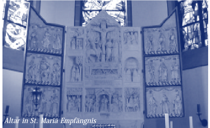
Altar in St. Mariä Empfängnis

Im letzten Jahr fand vor den Sommerferien die ökumenische Bibelwoche zusammen mit unseren Geschwistern aus St. Mariä Empfängnis statt. Wir haben uns dabei näher kennen gelernt und auch entdeckt, was uns im christlichen Glauben miteinander verbindet. Die gute ökumenische Zusammenarbeit wollen wir weiterführen und vertiefen, indem wir sechs Andachten in der Passionszeit miteinander feiern. Im Wechsel zwischen der evangelischen Gemeinde Philippus und der katholischen Gemeinde Mariä Empfängnis werden die Passionsandachten jeweils mittwochs um 19 Uhr stattfinden. Die Andacht - ohne eine lange Predigt - wird ca. eine halbe Stunde dauern, so dass Sie an dem Abend noch weitere Termine wahrnehmen können. Wir laden Sie alle dazu ganz herzlich ein und freuen uns, wenn Sie dabei auch den Schritt in die Nachbargemeinde wagen!